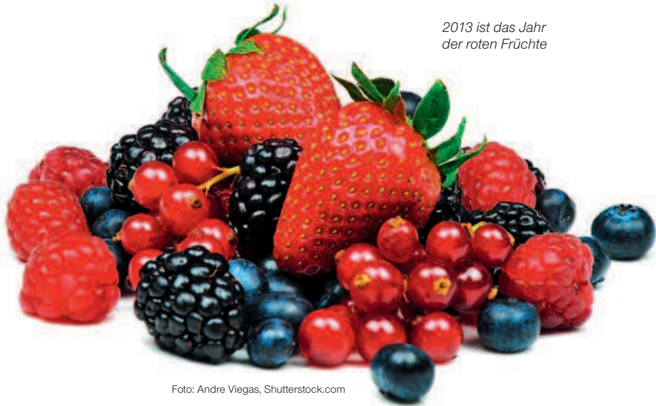
2013 ist das Jahr der roten Früchte

Zusätzlich zu unserem vielfältigen Portfolio aus ätherischen Ölen verwenden